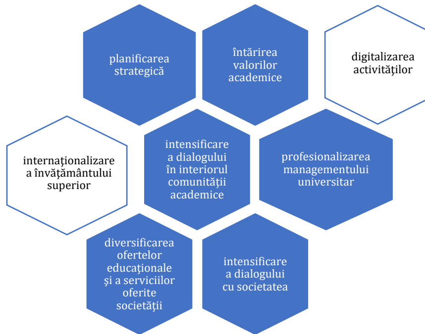
Fig. 1 Principalele elemente care definesc rolul asumat de SNSPA

Evaluarea calității, la nivelul SNSPA se face prin juxtapunerea activității unor structuri de tip umbrelă, care fixează cadrele generale pentru toate activitățile didactice și de cercetare ale universității cu activitatea derulată la nivelul fiecărei facultăți. Se construiește astfel o rețea care, prin structurile de la nivelul SNSPA asigură atât legătura cu mediul internațional și cu cadrul determinat de apartenența SNSPA în cadrul grupului CIVICA, cât și multiplicarea aceluiași set de principii și norme în cadrul fiecărei facultăți, în condiții de deplină flexibilitate și adaptabilitate care să le permită realmente acestora să aplice modele adecvate și măsuri în acord cu specificul domeniului lor, cu numărul de studenți, cu cercetările pe care le întreprind etc. Schema de mai jos redă principalele structuri de la nivelul SNSPA, rolurile lor în raport cu activitatea de evaluare a calității fiind detaliat în continuare, în funcție de felul în care contribuie la realizarea obiectivelor strategice ale SNSPA și anume: dezvoltarea relațiilor cu studenții, dezvoltarea cercetării, internaționalizare, dezvoltare instituțională, dezvoltarea relației cu mediul socio-economic.